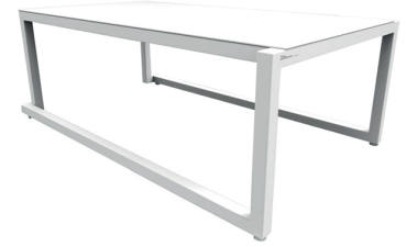
Table centrale empilable pour usage intérieur et extérieur. Structure en aluminium anodisé peint par pulvérisation et séché au four.