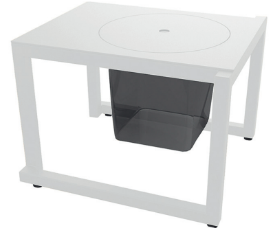
Table d'appoint de 50x45 pour usage intérieur et extérieur. Structure en aluminium anodisé peint par pulvérisation au four de 40x40 mm et de 2 mm d'épaisseur. Sur 3 mm d'épaisseur. Contient un seau à glace en polycarbonate transparent noir.