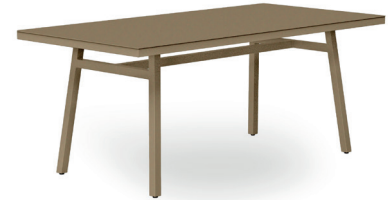
Table rectangulaire 180x90 pour usage intérieur et extérieur. Structure en aluminium anodisé peint par pulvérisation et séché au four de 40 x 40 mm et de 2 mm d'épaisseur. Sur 3 mm d'épaisseur.