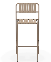
Tabouret Gelato Duna Lattes Duna