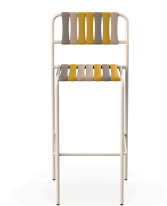
Tabouret Gelato Nocciola Nacar