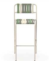
Tabouret Gelato Pistacchio Nacar