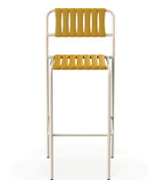
Tabouret Gelato Nacar + Lattes Albero