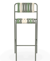
Tabouret Gelato Pistacchio Salvia