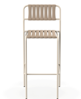
Tabouret Gelato Nacar + Lattes Duna