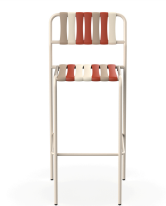
Tabouret Gelato Amarena Nacar