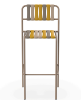
Tabouret Gelato Nocciola Duna