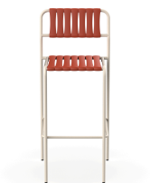
Tabouret Gelato Nacar + Lattes Greda