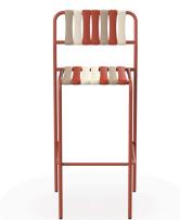
Tabouret Gelato Amarena Greda