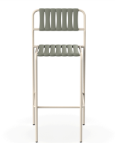
Tabouret Gelato Nacar + Lattes Salvia