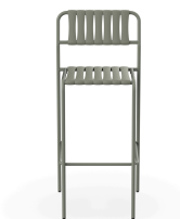
Tabouret Gelato Salvia + Lattes Salvia