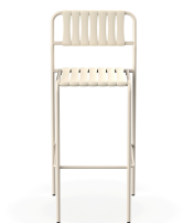
Tabouret Gelato Nacar + Lattes Nacar