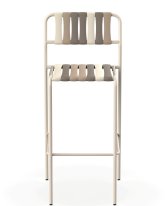
Tabouret Gelato Toroncino Nacar