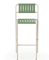
Tabouret Gelato Nacar + Lattes Olivo