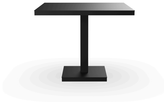
Table Barcino 90x90 Pied Central Noire