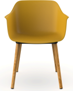
Fauteuil Shape Wood Toscan 05314