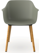
Fauteuil Shape Wood Gris- Vert 05310