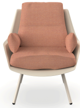
Fauteuil Anou Nacar Amber 07063