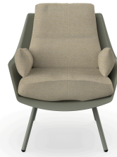
Fauteuil Anou Salvia Limonetto 07064