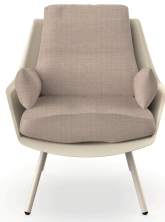
Fauteuil Anou Nacar Mud 07062