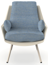
Fauteuil Anou Nacar Denim 07061