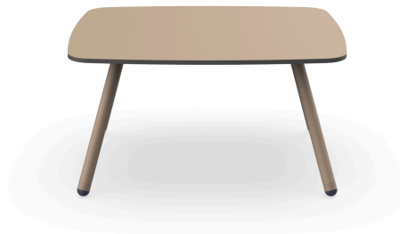
Table d'appoint Anou Nacar 07066