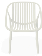
Fauteuil Bini Lounge Ivoire 05384