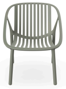
Fauteuil Bini Lounge Gris-Vert 05383