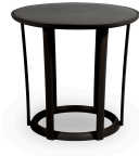
Table Raff Noire 04916