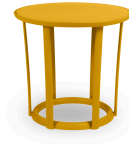
Table Raff Toscano 04919