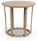
Table Raff Sable 04915