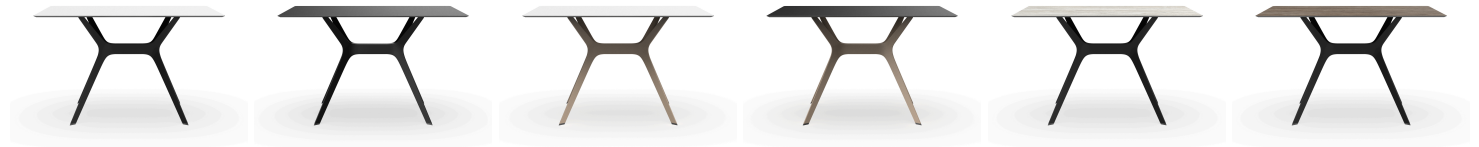
Table 120x80 Phénolique Blanche Pied De Table Vela &quot;m&quot; Noir 03094