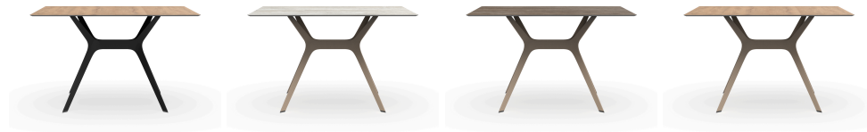
Table 120x80 Hpl Chêne Naturel Pied De Table Vela &quot;m&quot; Noir 04095