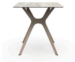
Table 70x70 Phénolique Bois Delavé Pied De Table Vela &quot;s&quot; Sable 04060