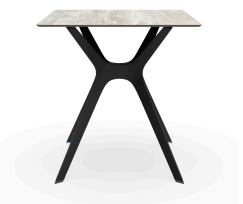
Table 70x70 Phénolique Bois Delavé Pied De Table Vela &quot;s&quot; Noir 04057