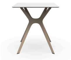
Phenolic White Table 70x70 Vela &quot;s&quot; Sand Table Foot 03061