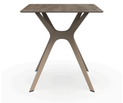
Table 70x70 Phénolique Chêne Cendré Pied De Table Vela &quot;s&quot; Sable 04061