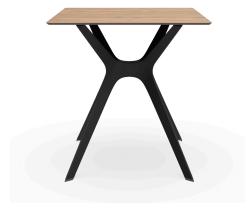
Table 70x70 Phénolique Chêne Naturel Pied De Table Vela &quot;s&quot; Noir 04059