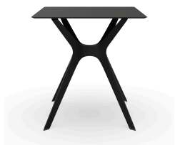
Table 70x70 Phénolique Noire Pied De Table Vela &quot;s&quot; Noir 03059