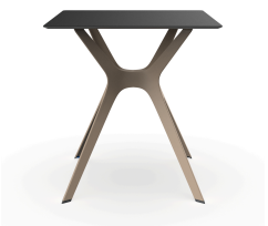
Table 70x70 Phénolique Noire Pied De Table Vela &quot;s&quot; Sable 03062