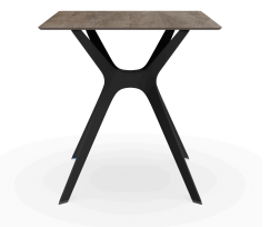
Table 70x70 Phénolique Chêne Cendré Pied De Table Vela &quot;s&quot; Noir 04058