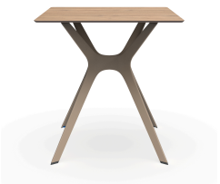
Table 70x70 Phénolique Chêne Naturel Pied De Table Vela &quot;s&quot; Sable 04062