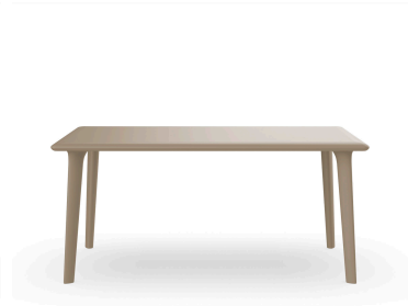
Table New Dessa 160x90 Sable 03947