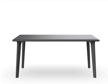
Table New Dessa 160x90 Gris Foncé 03946