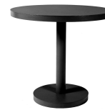
Table Barcino Ø80 Pied Central Noire 01424