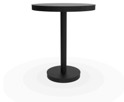
Table Barcino Ø60 Pied Central Noire 01432