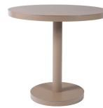
Table Barcino Ø80 Pied Central Sable 01423