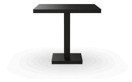
Table Barcino 80x80 Pied Central Noire 01413