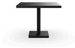
Table Barcino 90x90 Pied Central Noire 01422