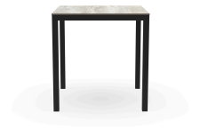
Table Barcino 70x70 Compact Bois Delavé/Noire 04021