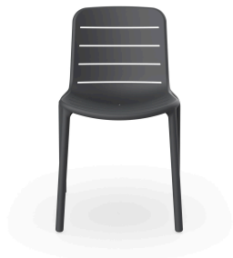
Chaise Gina gris foncé 06461