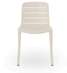
Chaise Gina Ivoire 07143