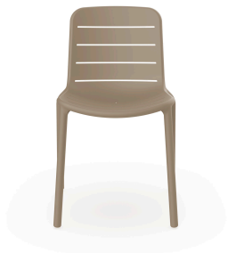
Chaise Gina Sable 03498