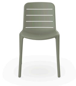
Chaise Gina gris verdâtre 06462