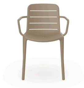
Fauteuil Gina Sable 03493