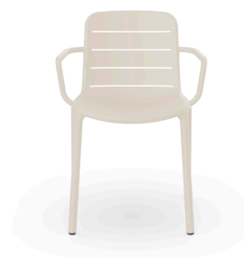
Fauteuil Gina Ivoire 07144