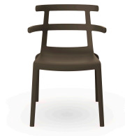
Chaise Tokyo Haute Chocolat 01621