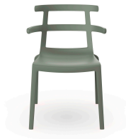
Chaise Tokyo Haute Gris-Verte 01620