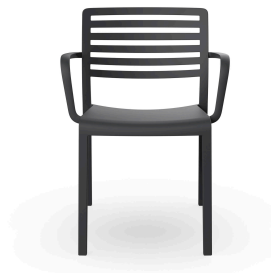
Fauteuil Lama Gris Foncé 01785