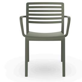
Fauteuil Lama Gris Vert 07055