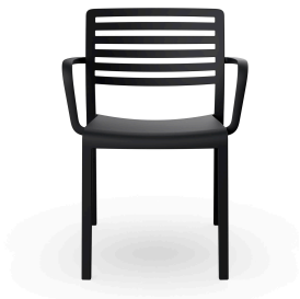
Fauteuil Lama Noir 00873