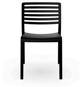
Chaise Lama Noire 00866