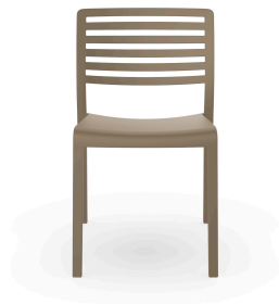
Chaise Lama Sable 01336