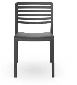
Chaise Lama Gris Foncée 01784