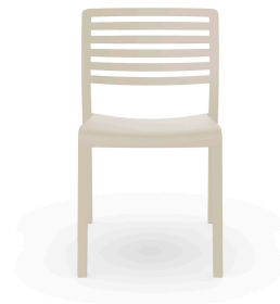
Chaise Lama Ivoire 07039