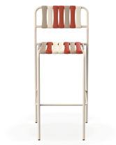
Tabouret Gelato Amarena Nacar 06927