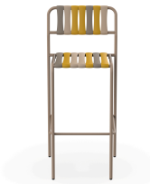
Tabouret Gelato Nocciola Duna 07286