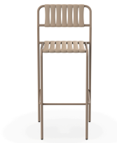
Tabouret Gelato Duna Lattes Duna 07293