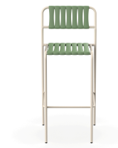
Tabouret Gelato Nacar + Lattes Olivo 06957