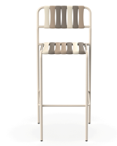
Tabouret Gelato Toroncino Nacar 06928