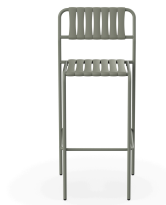
Tabouret Gelato Salvia + Lattes Salvia 06979