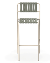
Tabouret Gelato Nacar + Lattes Salvia 06956