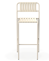
Tabouret Gelato Nacar + Lattes Nacar 06978