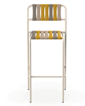
Tabouret Gelato Nocciola Nacar 06929