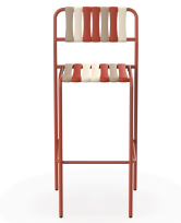
Tabouret Gelato Amarena Greda 07285