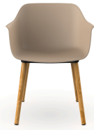
Silla Shape Wood Arena 05311