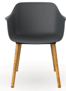
Silla Shape Wood Gris Oscuro 05312