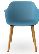
Silla Shape Wood Azul Retro 05313