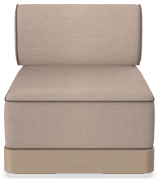
Brisa Basic Duna Coussin Mud + Mocha 06793