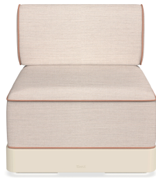
Brisa Basic Nácar Coussin Hazelnut + Amber 06794