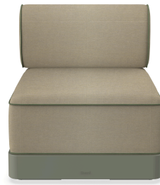
Brisa Basic Salvia Coussin Limonetto + Fern 06795