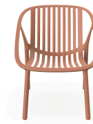
Fauteuil Bini Lounge Terra Cotta 05385