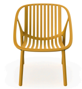
Fauteuil Bini Lounge Toscan 05386