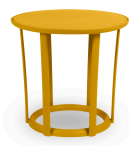
Table Raff Toscano 04919