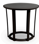
Table Raff Noire 04916