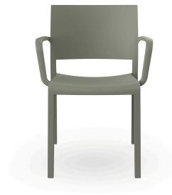
Chaise New Fiona Gris vert 07140