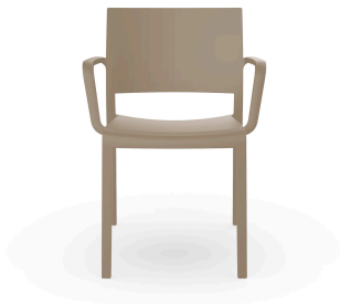
Fauteuil New Fiona Sable 03540