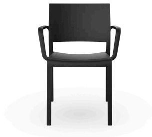
Fauteuil New Fiona Noir 03542