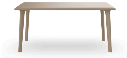
New Dessa 160x90 Table Sand 03947..1X.