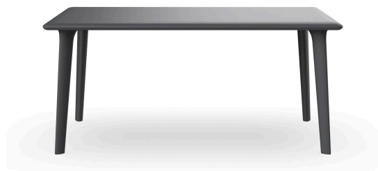
New Dessa 160x90 Table Dark Grey 03946..1X.