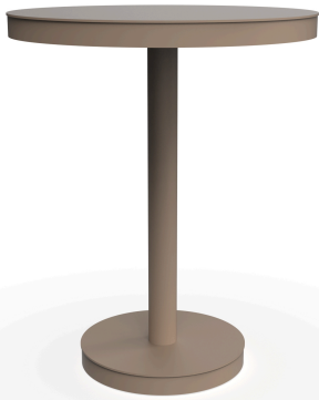
Barcino Sand Table Ø60 Central Leg 01431..1X.