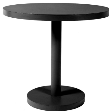
Barcino Sand Table Ø80 Central Leg 01423..1X.