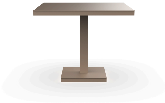
Barcino Sand Table 90x90 Central Leg 01421..1X.