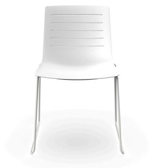
Silla Patin Skin Blanca 03458..4X.