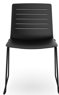
Silla Patin Skin Negra 06718..4X.