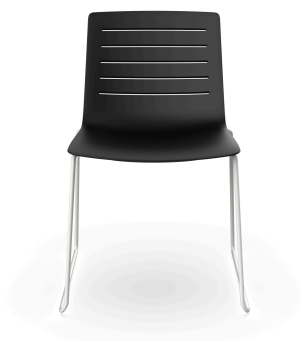
Silla Patin Skin Negra Estructura Blanca 03459..4X.