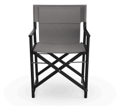
Boss Noche Chair Smoke Fabric 06823..2X.