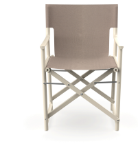
Boss Nácar Chair Mud Fabric 06827..2X.