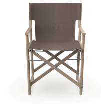
Boss Duna Chair Mocha Fabric 06825..2X.