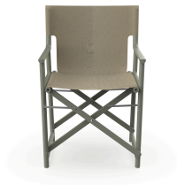
Boss Salvia Chair Limonetto Fabric 06824..2X.