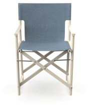
Boss Nácar Chair Denim Fabric 06828..2X.