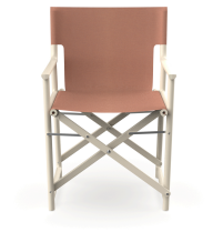
Boss Nácar Chair Amber Fabric 06826..2X.