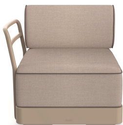
Brisa Terminal Duna Cushion Mud+Mocha 06880..1X.