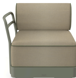
Terminal Brisa Salvia Cushion Limonetto + Fern 06882..1X.