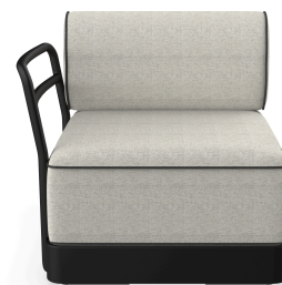
Brisa Terminal Noche Cushion Salina 05 + Dolce 55 06883..1X.