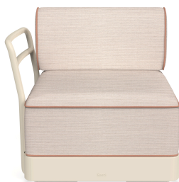
Brisa Terminal Nacar Cushion Hazelnut + Amber 06881..1X.