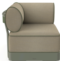
Brisa Corner Salvia Cushion Limonetto + Fern 06799..1X.