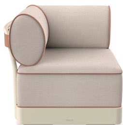
Brisa Corner Nacar Cushion Hazelnut + Amber 06798..1X.