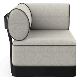
Brisa Corner Noche Cushion Salina 05 + Dolce 55 06800..1X.