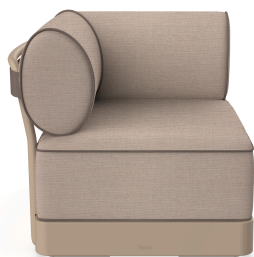
Brisa Corner Duna Cushion Mud + Mocha 06797..1X.