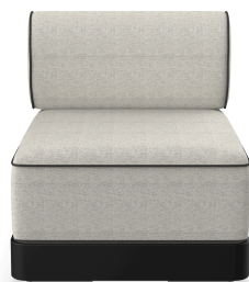
Brisa Basic Noche Salina 05 Cushion + Dolce 55 06796..1X.