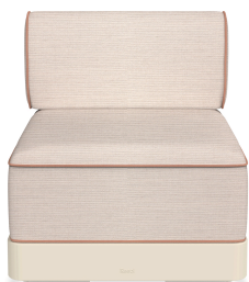
Brisa Basic Nácar Cushion Hazelnut + Amber 06794..1X.