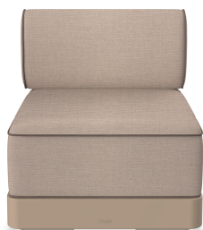
Brisa Basic Duna Cushion Mud + Mocha 06793..1X.