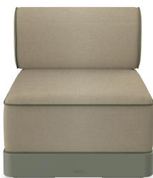
Brisa Basic Salvia Cushion Limonetto + Fern 06795..1X.