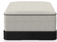
Brisa Ottoman Night Cushion Salina 05 + Dolce 55 06792..1X.