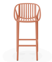
Terracotta Bini High Stool 06541..4X.