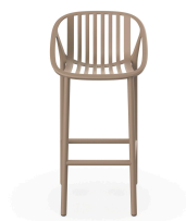
Sand Bini High Stool 06543..4X.