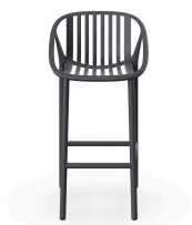
Dark Grey Bini High Stool 06538..4X.