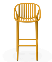
Tuscan Bini High Stool 06542..4X.