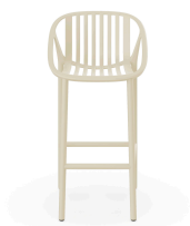
Stool Ivory Bini High Stool 06540..4X.