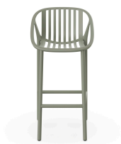
Greenish Grey Bini High Stool 06539..4X.