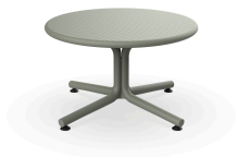
Greenish Grey Bini Lounge Table 05399..1X.