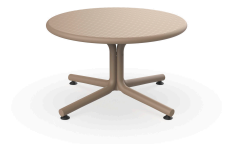
Sand Bini Lounge Table 05403..1X.