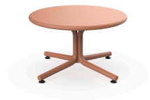
Terracotta Bini Lounge Table 05401..1X.