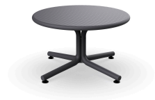
Dark GrEy Bini Lounge Table 05398..1X.