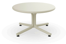
Ivory Bini Lounge Table 05400..1X.