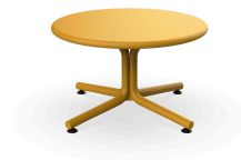
Tuscan Bini Lounge Table 05402..1X.