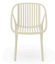
Bini Chair Ivory 05378..4X.