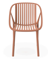
Bini Chair Terra Cotta 05379..4X.