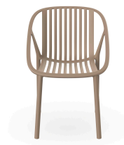
Bini Chair Sand 05381..4X.