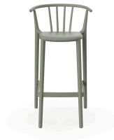
High Woody Green-Grey Barstool 05448..4X.