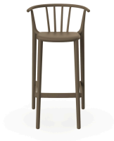
High Woody Chocolate Barstool 05446..4X.