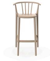
High Woody Sand Barstool 05449..4X.