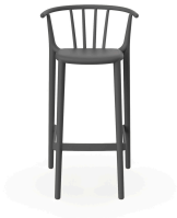
High Woody Dark Grey Barstool 05450..4X.