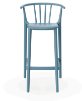
High Woody Retro Blue Barstool 05447..4X.