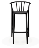
High Woody Black Barstool 05445..4X.