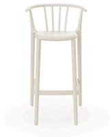
High Woody Ivory Barstool 05444..4X.