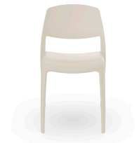
Smart Chair Ivory 07114..4X.