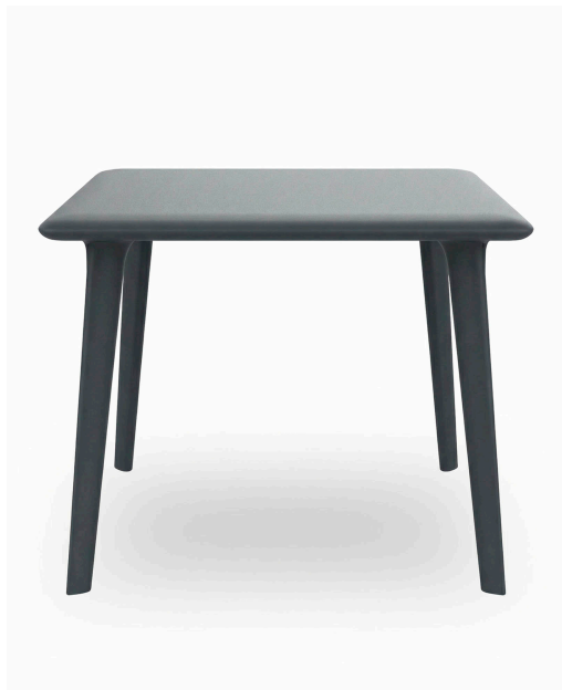
New Dessa 90x90 Table Dark Grey 03944..1X.