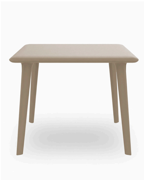
New Dessa 90x90 Table Sand 03945..1X.