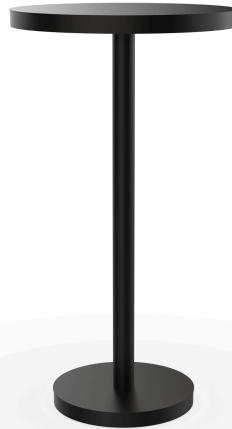
Barcino Black Table Ø60 High Central Leg 01434..1X.