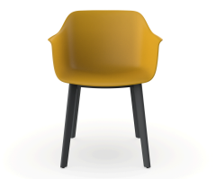
Silla Shape Toscano patas Click 05193..2X.