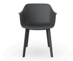
Silla Shape Gris Oscuro patas Click 05191..2X.