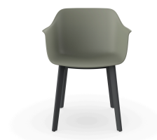
Silla Shape Gris Verdoso patas Click 05462..2X.