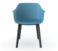
Silla Shape Azul retro patas Click 05460..2X.