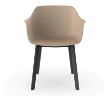
Silla Shape Arena patas Click 05461..2X.