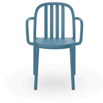
Sue Lamas Armchair Retro Blue 05176..4X.