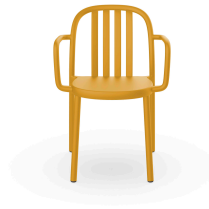
Sue Lamas Armchair Tuscan 05177..4X.