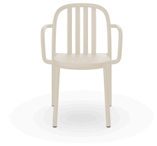
Sue Ivory Armchair 07142..4X.