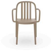
Sue Lamas Armchair Sand 05175..4X.