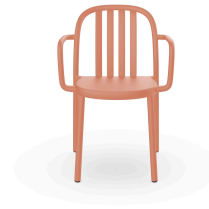
Sue Lamas Armchair Terra Cotta 05178..4X.