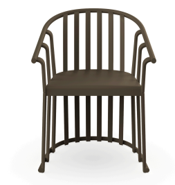
Chocolate Raff Armchair 04913..4X.