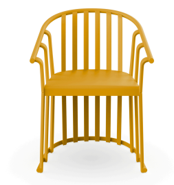
Toscano Raff Armchair 04912..4X.