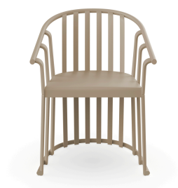
Sand Raff Armchair 04908..4X.