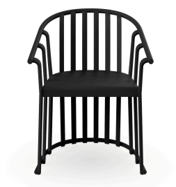
Black Raff Armchair 04909..4X.