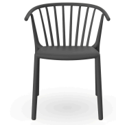
Woody Chair Dark Grey 04151..4X.