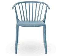
Woody Chair Retro Blue 04152..4X.