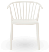
Woody Chair Ivory 04147..4X.