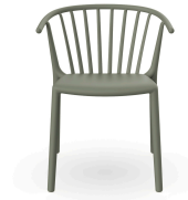
Woody Chair Green Grey 04150..4X.