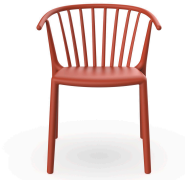
Woody Chair Greda 07022..4X.