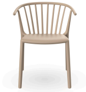
Woody Chair Sand 04148..4X.