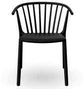
Woody Chair Black 04461..4X.