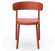
Casino Chair Greda 07107..4X.