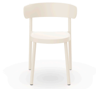
Casino Chair Ivory 03954..4X.