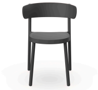
Casino Chair Dark Grey 03953..4X.