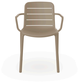
Gina Armchair Sand 03493..4X.