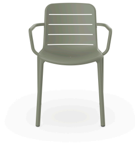
Green Grey Gina chair with arms 06460..4X.