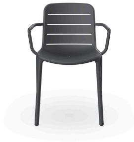
Grey Gina Chair with arms 05261..4X.