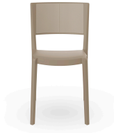
Spot Chair Sand 01653..4X.