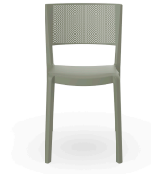
Spot Chair Green-Grey 04599..4X.