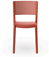
Spot Chair Greda 07132..4X.