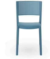
Spot Chair Retro Blue 04600..4X.