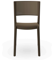
Spot Chair Chocolate 01651..4X.