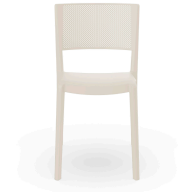
Spot Chair Ivory 07131..4X.