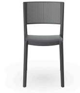
Spot Chair Dark Grey 03960..4X.